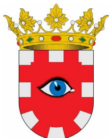
AJUNTAMENT D'ALCÚDIA DE VEO