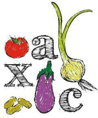
XARXA AGROECOLÒGICA DE CASTELLÓ