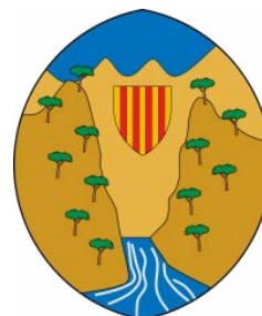
AJUNTAMENT DE VALLIBONA