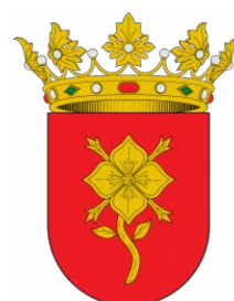
AYUNTAMIENTO DE MATET