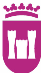
Ajuntament de Vilanova d'Alcolea