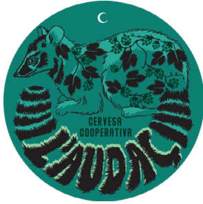
Cerveseria L'Audaç - La Somniada